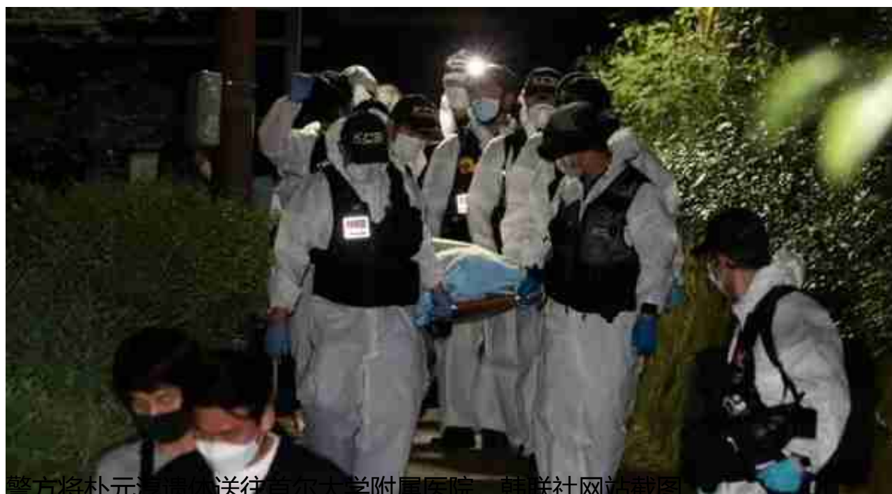
警方将朴元淳遗体送往首尔大学附属医院。

据韩联社报道，当地时间7月10日凌晨，朴元淳失踪7个小时后，警方在城北区肃靖门附近发现了他的遗体，案发现场还发现了朴元淳的书包、水壶、手机、钢笔以及他的名片。