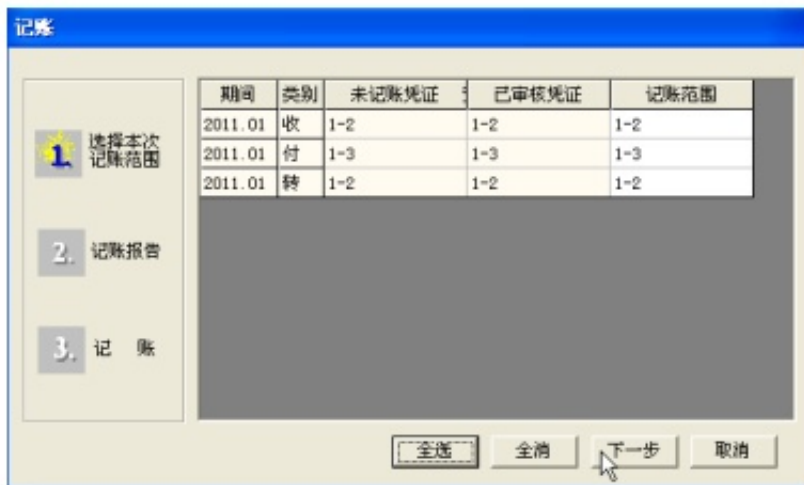
图 2-6 记账-选择凭证