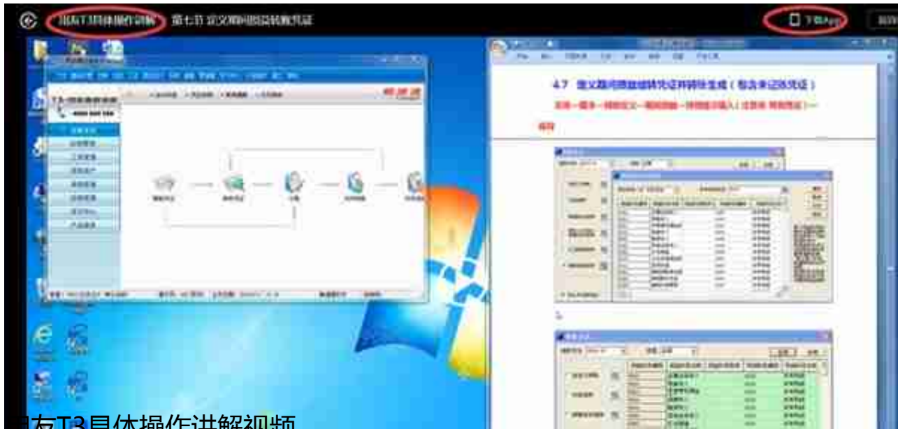
用友T3具体操作讲解视频