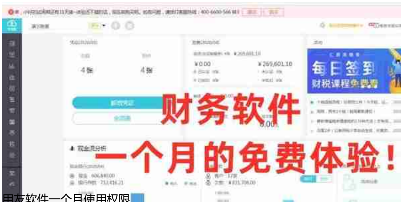
用友软件一个月使用权限