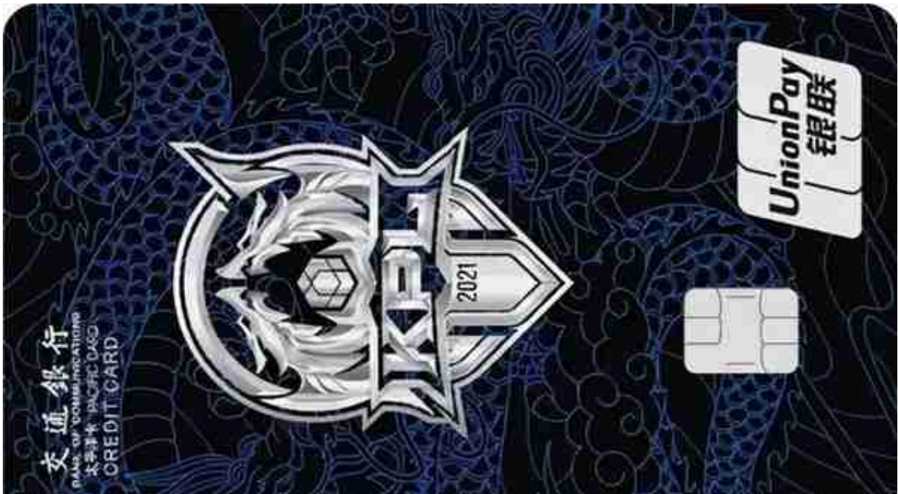
▲王者荣耀职业联赛主题卡