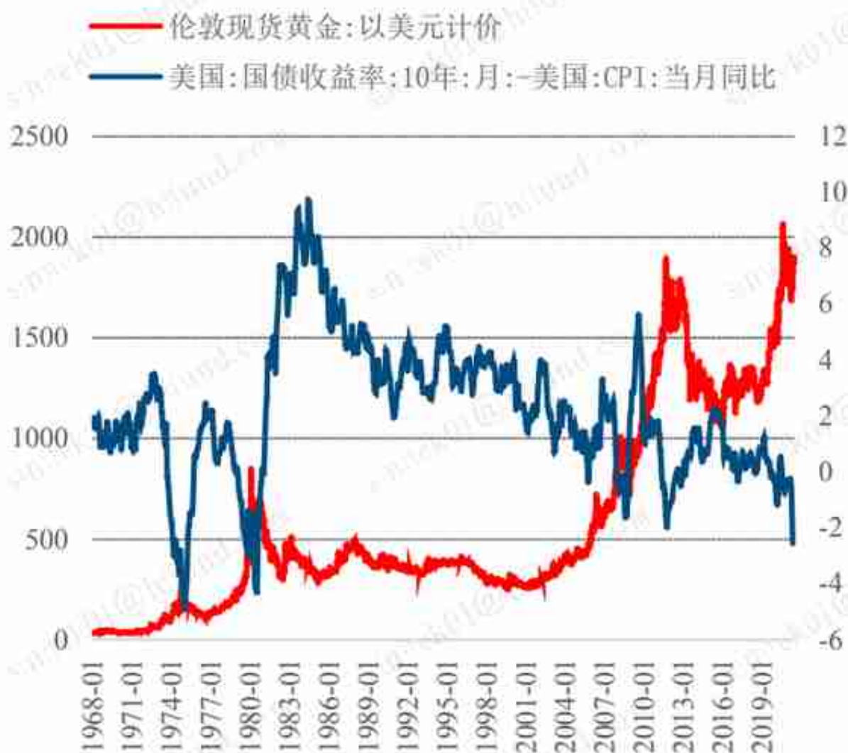
图表29： 黄金与实际利率