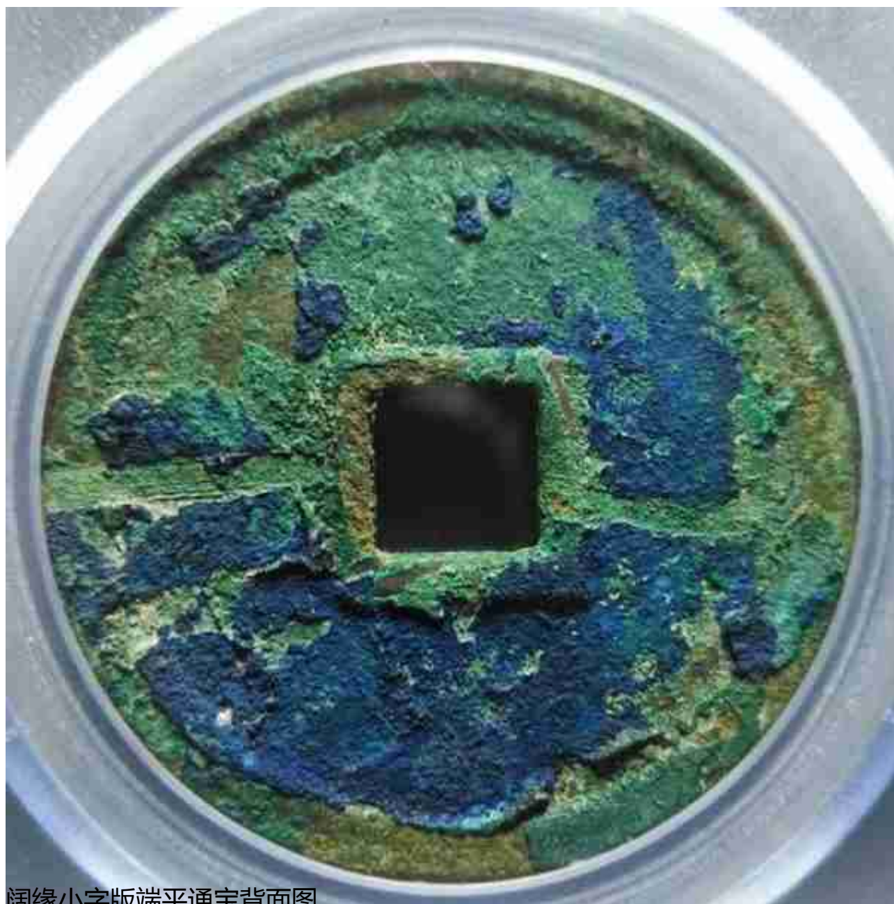
阔缘小字版端平通宝背面图

大家都知道，普通的端平通宝分为两个普通版别，一种是长宝短平，另外一种短宝长平。这个在上一期讲端平通宝的文章中已经和大家说过了，这里就不再过多讲解了，给大家看一看今天的主角，端平通宝阔缘小字版是什么样子的。