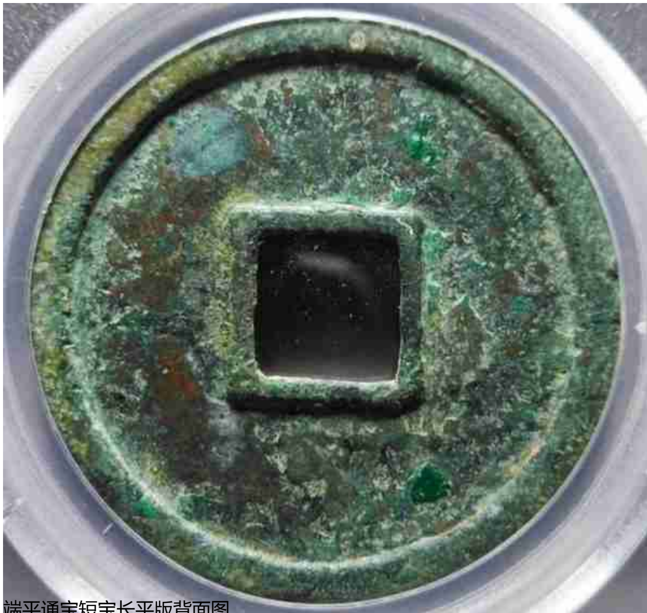
端平通宝短宝长平版背面图