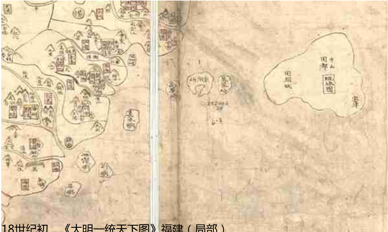
18世纪初，《大明一统天下图》福建（局部）

军往降之，不听命则遂伐之，朝廷从其请。……成宗元贞三年（公元1297年），福建省平章政事高兴言，今立省泉州，距琉求为近，可伺其消息，或宜招宜之，不必它调兵力，兴请就近试之。九月，高兴遣省都镇抚张浩、福州新军万户张进赴琉求国，擒生口一百三十余人。”