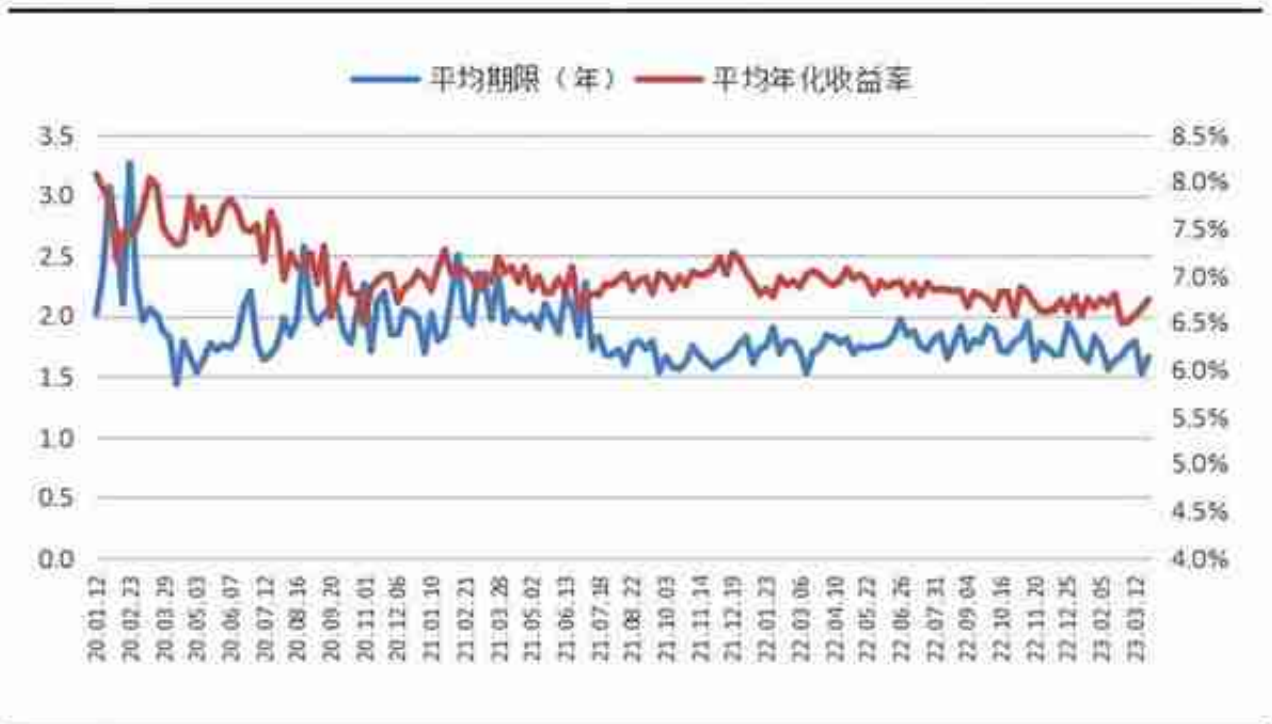
图 5: 2020年以来非标类信托产品平均预期收益走势图