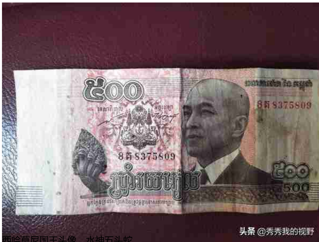
西哈莫尼国王头像，水神五头蛇