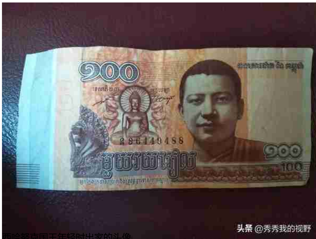
西哈努克国王年轻时出家的头像