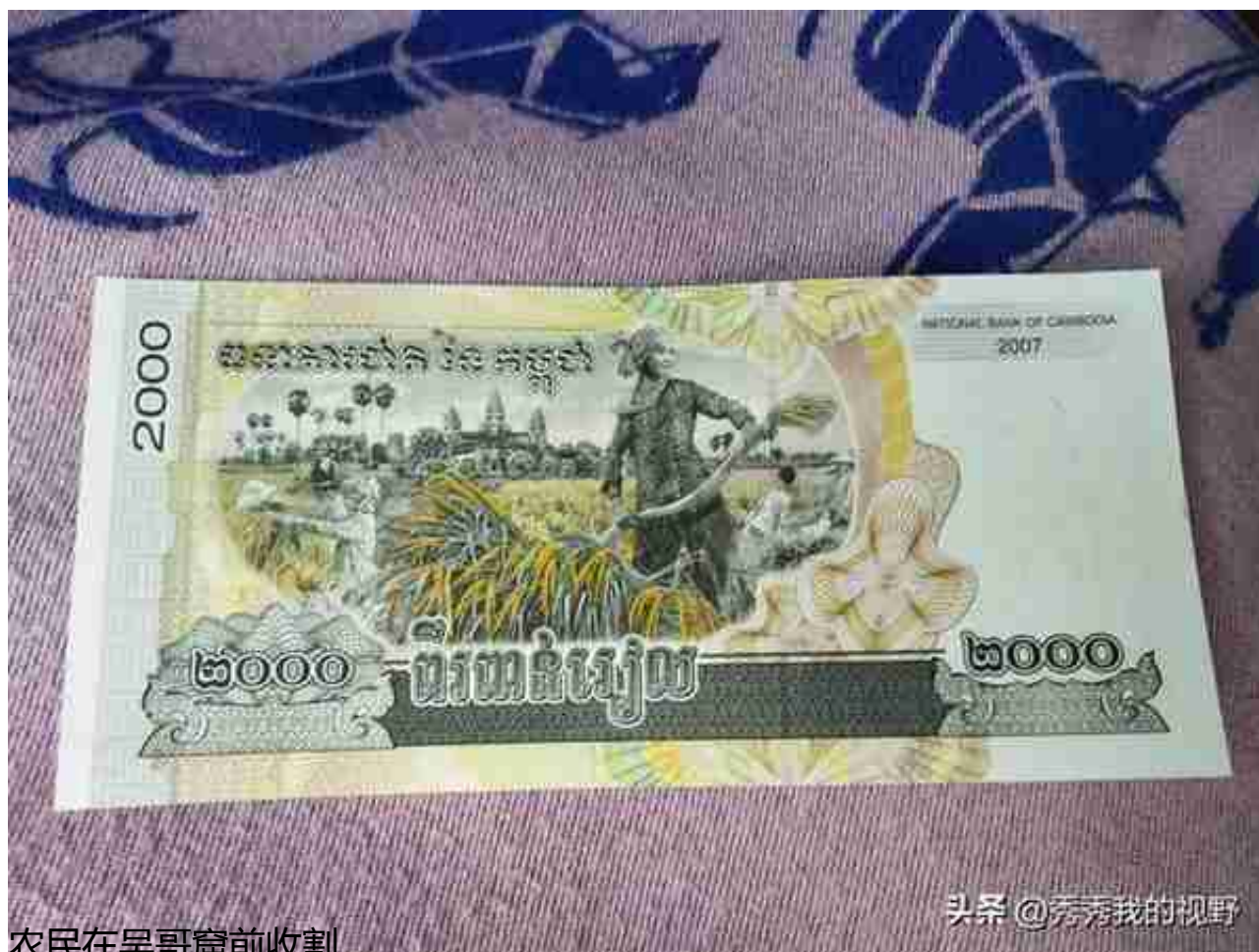
农民在吴哥窟前收割