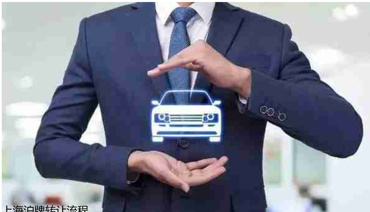
上海沪牌转让流程