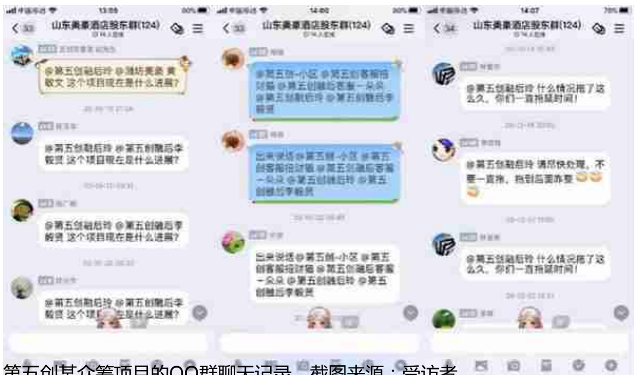
第五创某众筹项目的QQ群聊天记录。