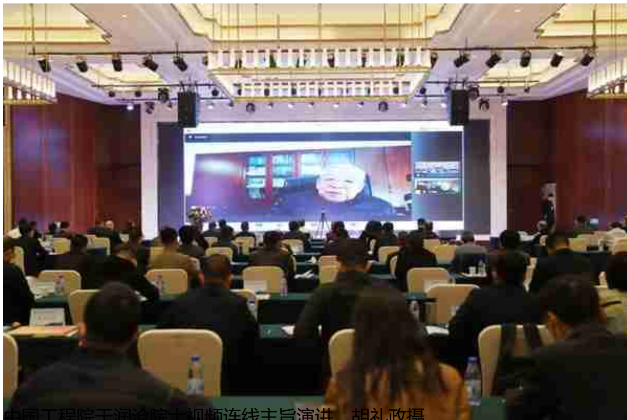
中国工程院于润沧院士视频连线主旨演讲。

新矿集团党委书记、董事长孙斌表示，集团将按照自治区党委、政府提出的“一年转采、两年完成勘探、三年矿山与冶炼厂达产、五年下游产业年产值不低于150亿元”的部署要求，形成集商贸物流、工程建设、运输服务、矿业投资、地质服务于一体大型现代化绿色矿业产业集群，着力打造世界级铅锌产业基地。