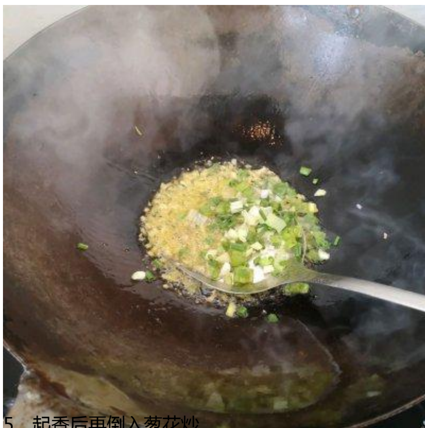
5、起香后再倒入葱花炒。