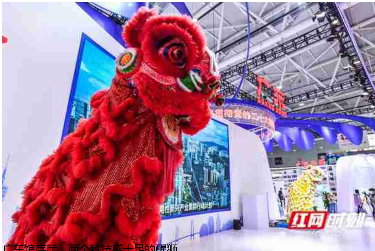
广东馆序厅，两个科技感十足的醒狮。

在广东省展区，中央沙盘涵盖了粤港澳大湾区50个文化旅游地标建筑，9地市美景尽收眼底。粤东粤西深度挖掘海丝文化和海岛资源，打造特色鲜明、优势突出、消费畅旺的滨海文化旅游经济旅游带。