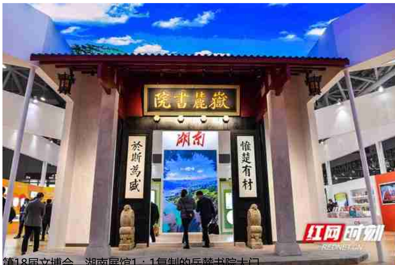
第18届文博会，湖南展馆1：1复制的岳麓书院大门。

1月2日，第十八届中国（深圳）国际文化产业博览交易会（以下简称“文博会”）在深圳国际会展中心圆满闭幕。