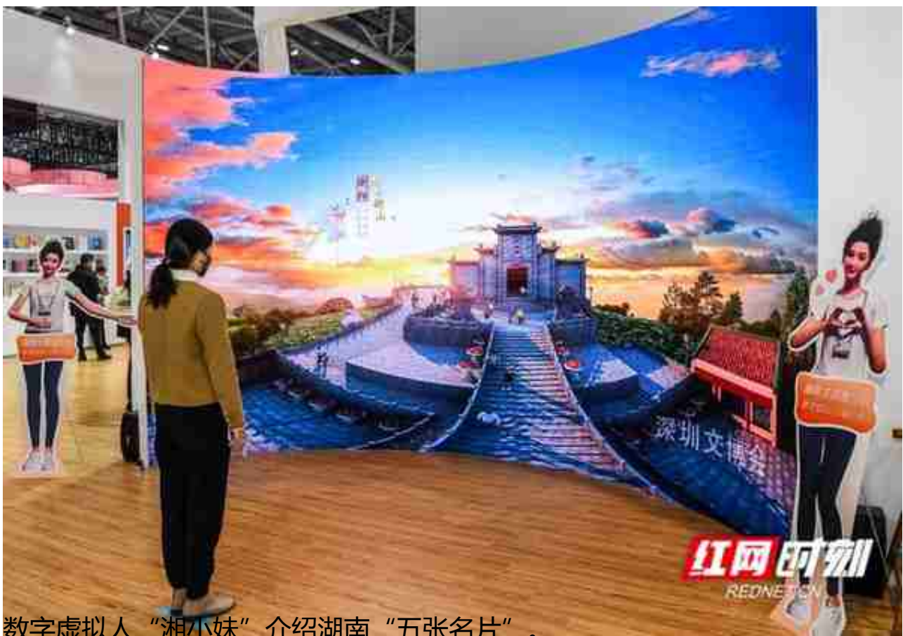
数字虚拟人“湘小妹”介绍湖南“五张名片”。

在湖南出版集团展区，从拿过全国“五个一”工程奖、中国出版政府奖、中华优秀出版物奖的出版物，到“智趣新课后”“e堂好课”等数字教育产品；从成绩斐然居全国前列的发行和绿色印刷业务，到红网、时刻新闻、潇湘晨报、快乐老人报、大湘网、地铁传媒等一众多元融合的媒介；从图文、视频、互动体验、实物等多种载体的展陈，到中南国家数字出版基地项目的宣传片，不仅展现了中南传媒在传统与科技两方面的丰硕成果，彰显着中南传媒14年蝉联“全国文化企业30强”的实力，更立体阐释了“出版湘军”入驻马栏山视频文创产业园打造湖南出版“梦工厂”的未来发展新引擎。