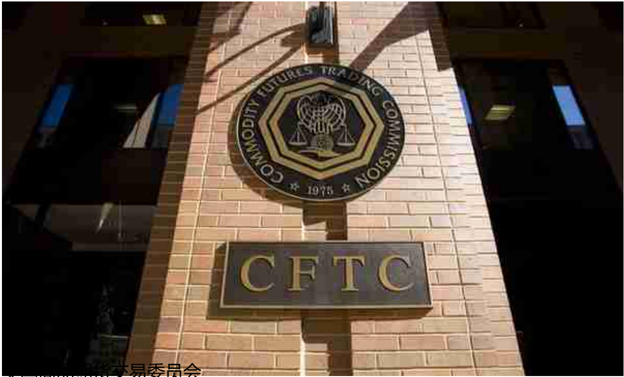
美国商品期货交易委员会