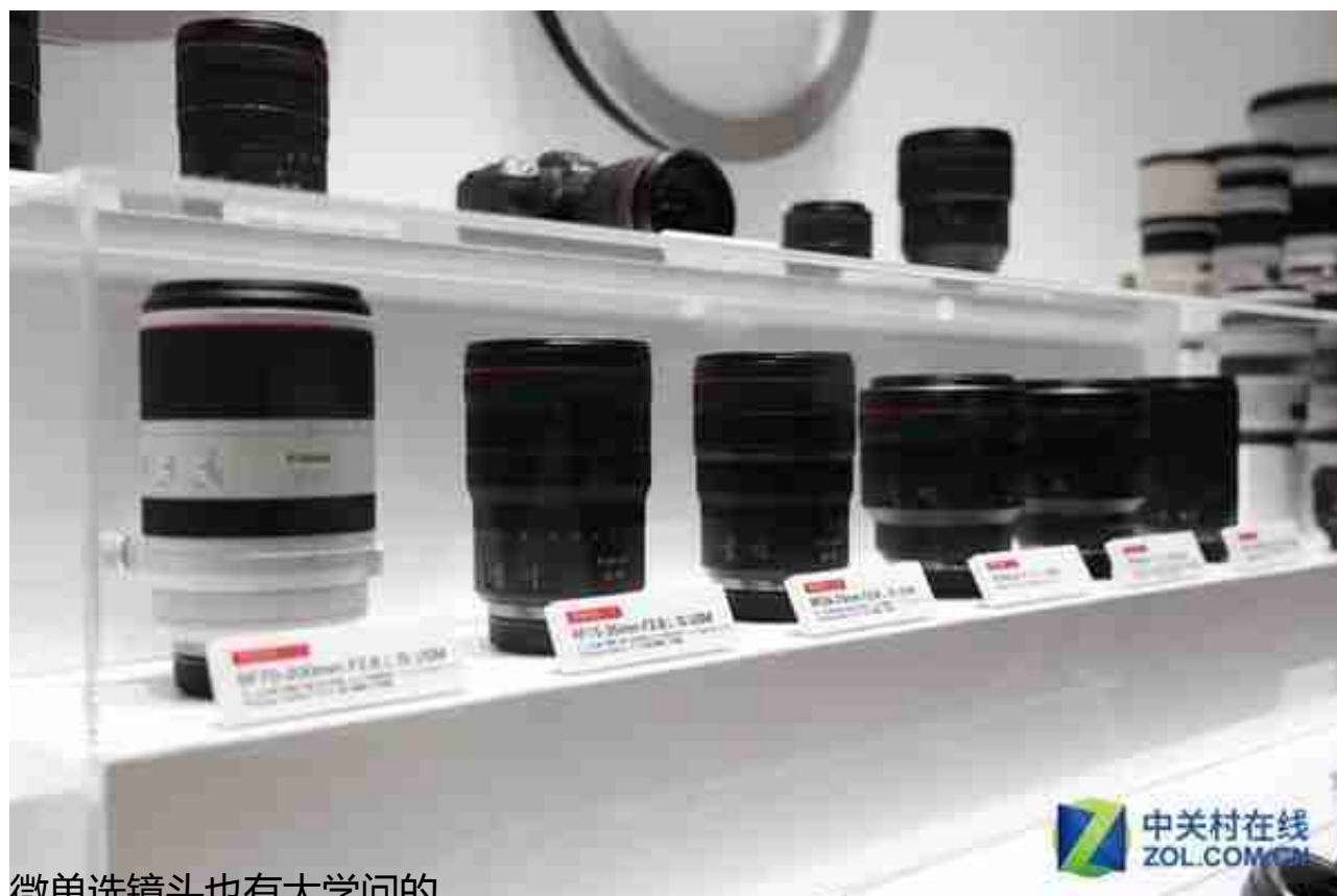
微单选镜头也有大学问的

如果非要为微单选配镜头，笔者可以给大家一些建议。一般用户刚开始接触摄影，都是从标准焦段变焦镜头开始，这样可以在入门摄影的同时，体会到一些常用的不同焦段带来的画面感受。之后可以了解自己适合什么焦段，适合什么题材，是不是应该往广角或者长焦方面继续发展，如果购买定焦镜头的话，自己最有把握掌控哪个焦段。