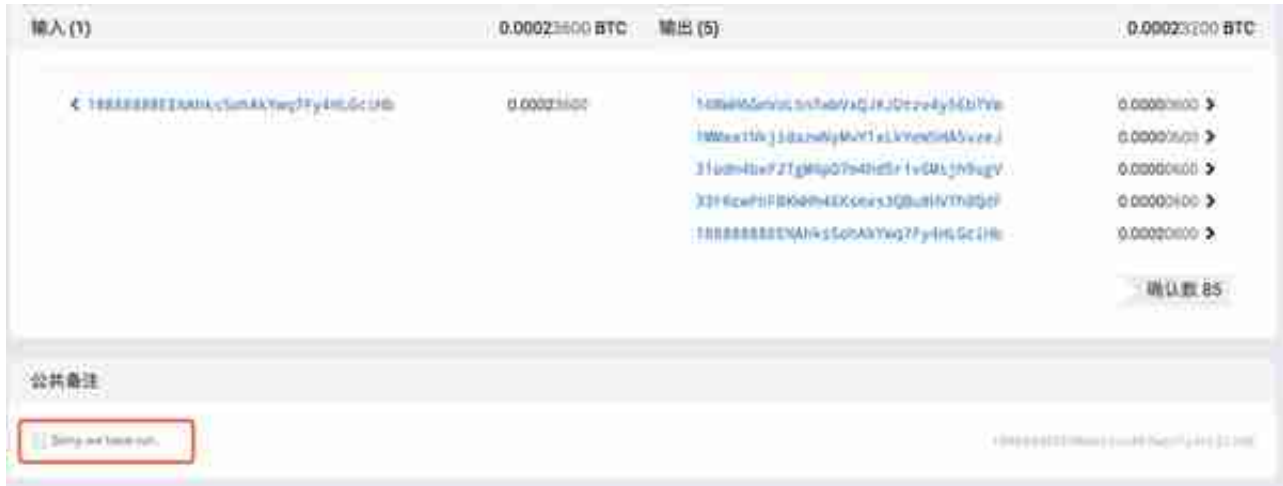
图示 6: 一笔有趣的交易

与此同时，PeckShield 安全人员发现 PlusToken 另一个钱包汇聚地址 33FKcwFh 开头的地址中资产于08月13日发生异动，并通过 14gKbB4A 开头地址于08月14日11点54分转移到四个地址中，每个地址暂存4,922，5,000，6,000，7,000 BTC 不等，这部分资金暂时还未进一步转移。