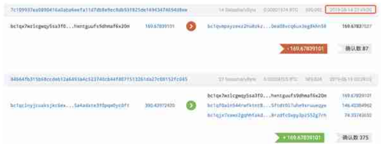
图示 4: 资金以50-200 BTC 不等转入多个地址

1) 大额资产经过多次中转，最终由 39fXUWCy 开头地址分散转出，新地址 BTC 数目在1,000左右。