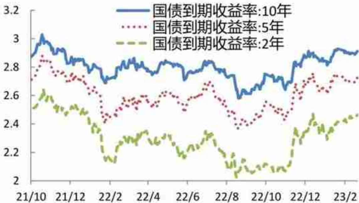
图 6：2/5/10 年期国债收益率走势（%）

1月份欧元区和英国制造业PMI也有所回升，欧元区私营部门经济在2023年初意外恢复增长，提振了市场对于欧元区经济“软着陆”的希望。IMF发布的《全球经济展望报告》上调了今年的全球经济增长预测，是一年以来的首次，预计今年全球整体GDP将增长2.9%，比10月份的预测提高了0.2个百分点。整体上看，当前海外市场经济增长韧性仍强，衰退预期弱化，海外央行未来演进及影响仍需要高度关注。