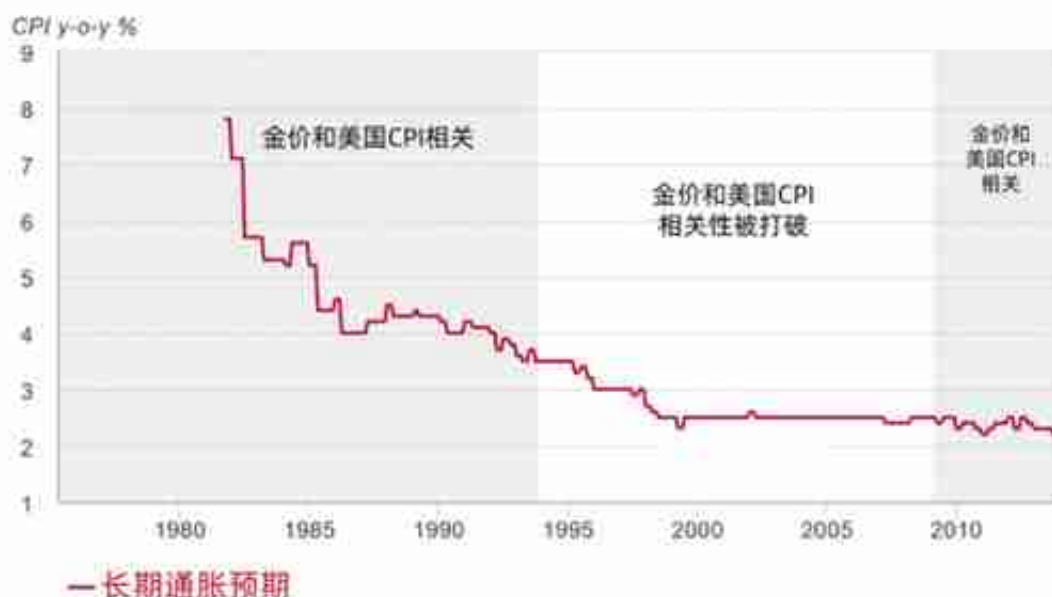
图 3：金价与 CPI 间关系