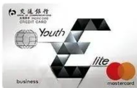
优逸白金信用卡套卡