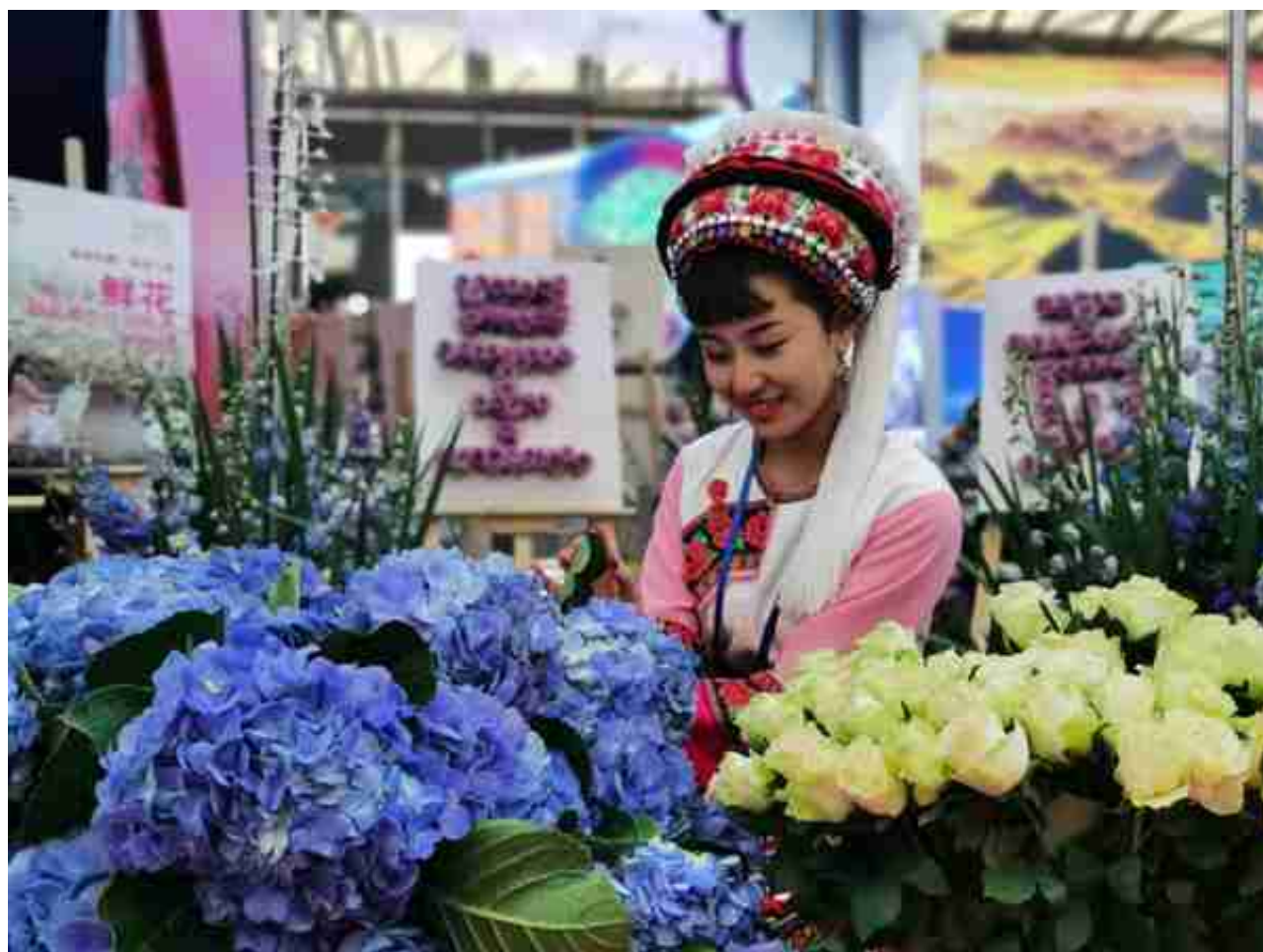
资料图 昆明市委宣传部 供图

云南的花不仅是我们的生活，也是我们的地标和名片。来到云南大家都会感叹，漫山遍野都是鲜花。绣球花在大家眼里是比较难种植的一种花，但在云南，大家可以看到满山的绣球花海。