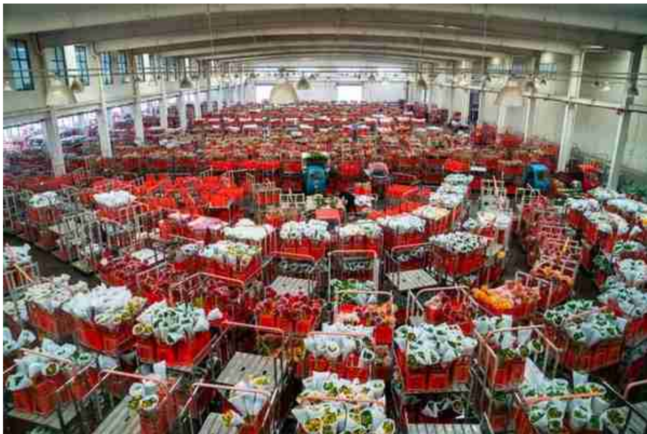
资料图 昆明市委宣传部 供图