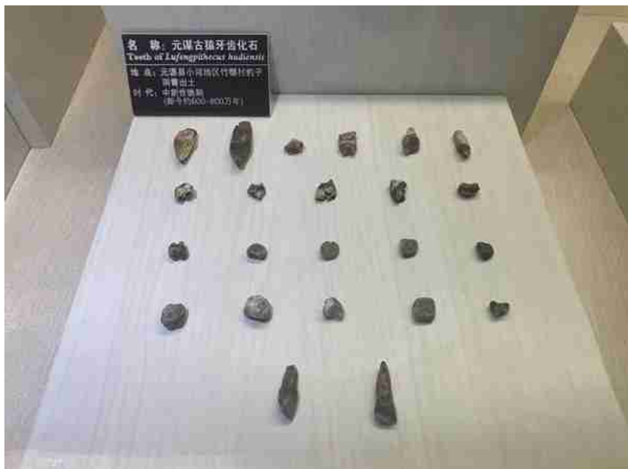
元谋古猿牙齿化石