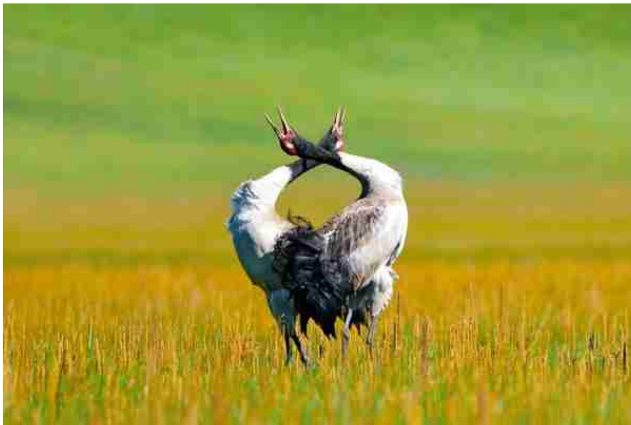
纳帕海黑颈鹤 资料图