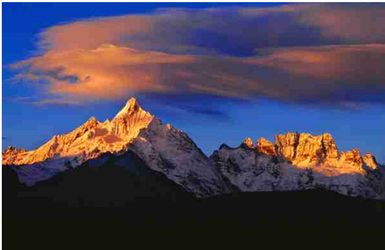
梅里雪山

从滇西地区的 火山热海、一寨两国、佤山秘境 到滇中、滇东地区的 石林名胜、土林奇观、红土美景