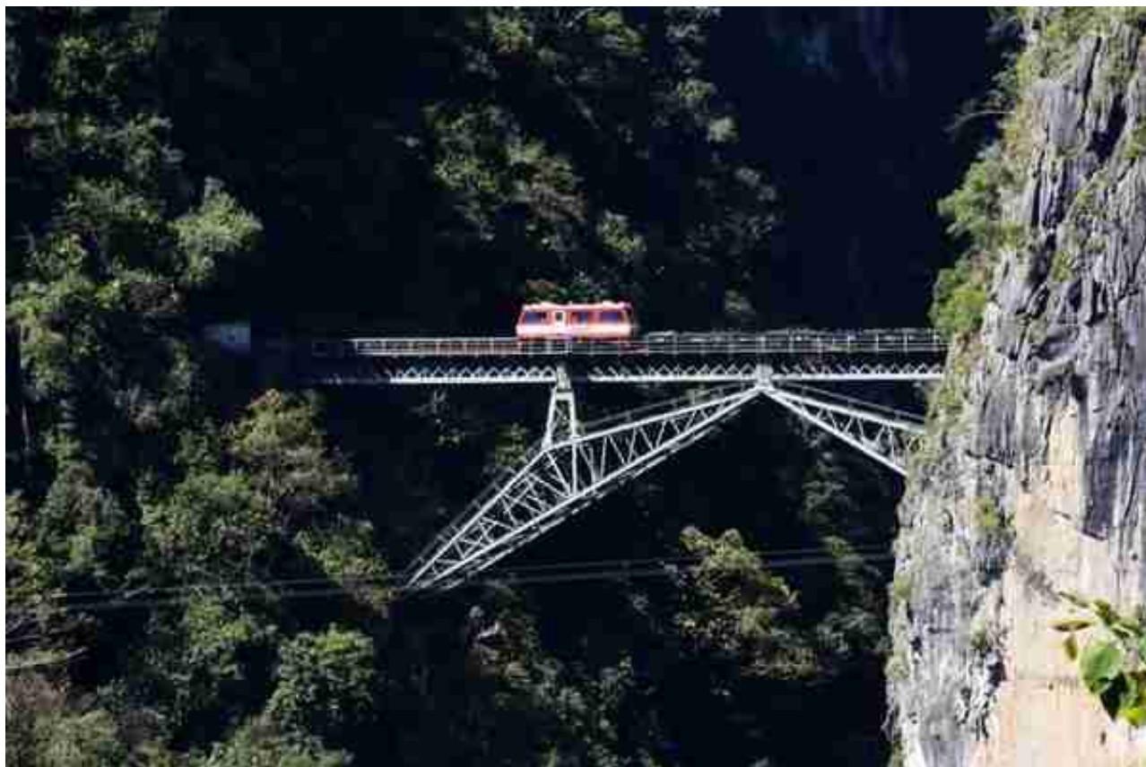
滇越铁路 2021年通车的中老铁路