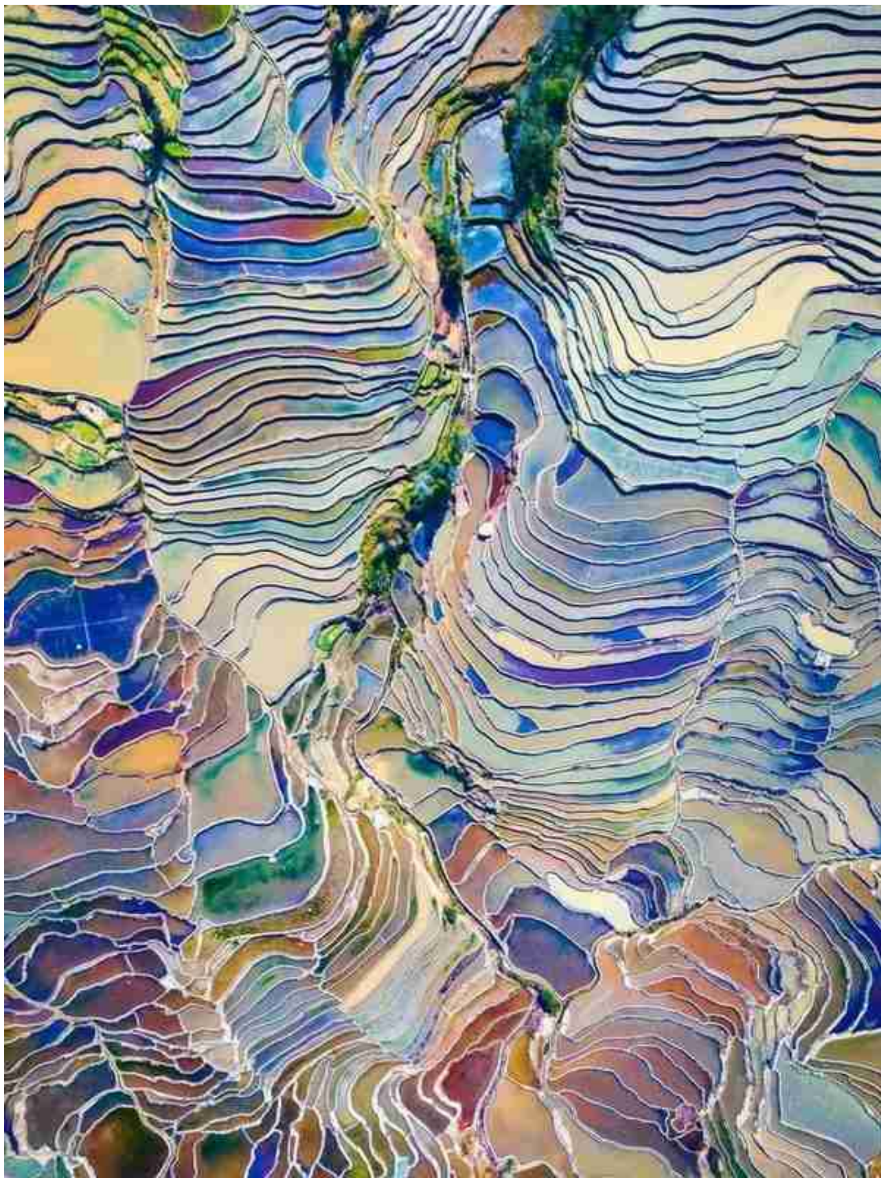
元阳梯田