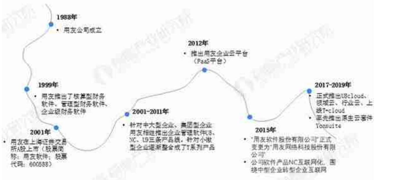
图表2：用友网络成长历程

目前国内工业互联网领先企业有用友网络、东方国信、启明星辰、浪潮信息等。其中用友网络与浪潮信息处于领先地位。从研发能力来看，用友网络从研发人员数量上具有优势，而研发投入金额上浪潮信息略胜一筹。从经营能力上看，浪潮信息营业收入大幅超过用友网络，而用友网络毛利率显著高于浪潮信息。