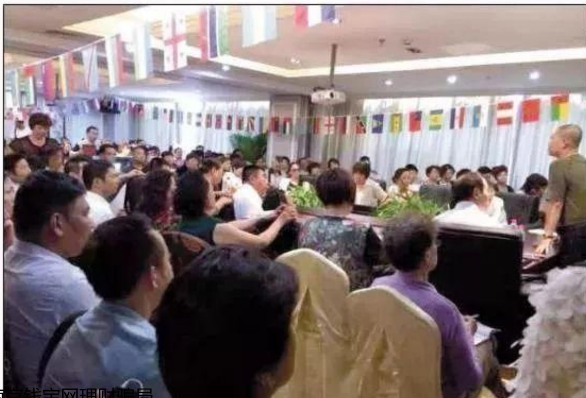
南京钱宝网理财骗局