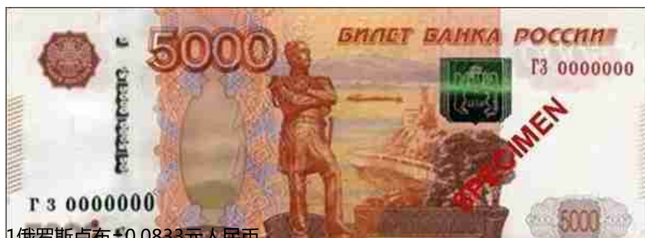
1俄罗斯卢布=0.0833元人民币