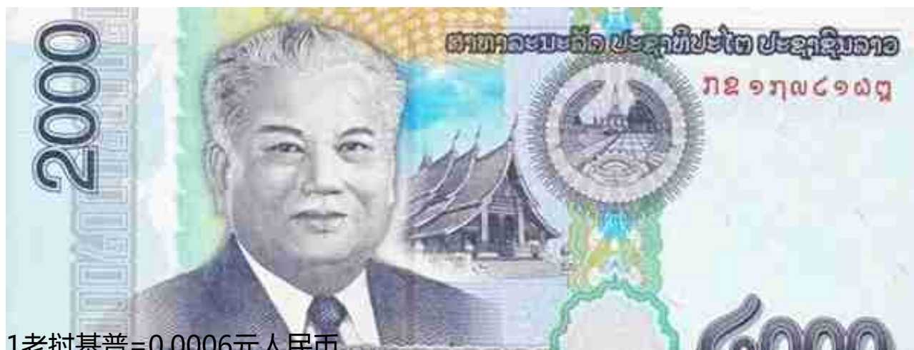
1老挝基普=0.0006元人民币