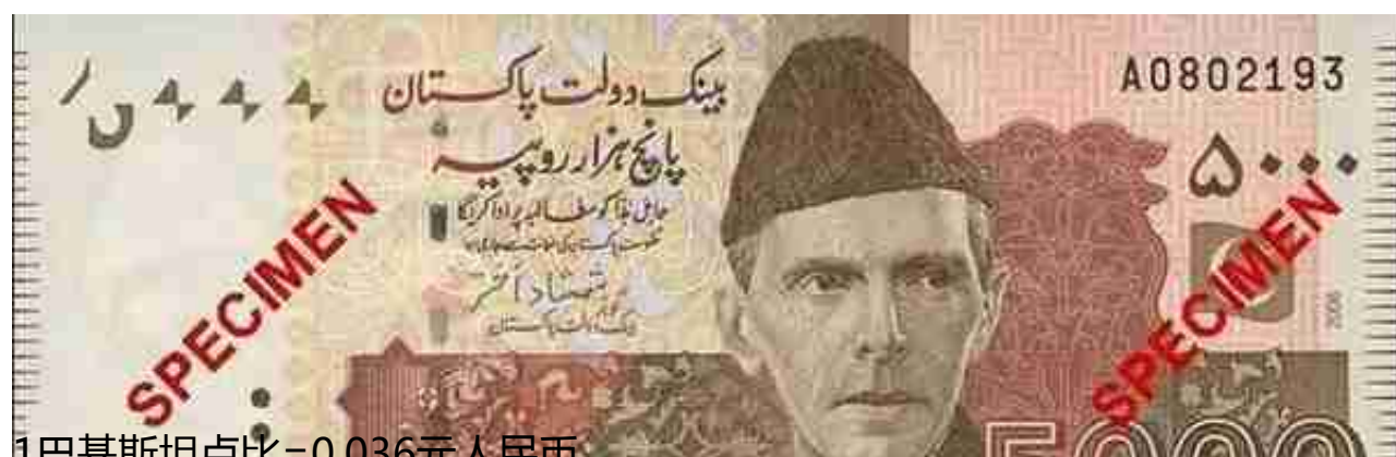
1巴基斯坦卢比=0.036元人民币