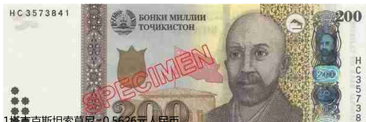
1塔吉克斯坦索莫尼=0.5626元人民币