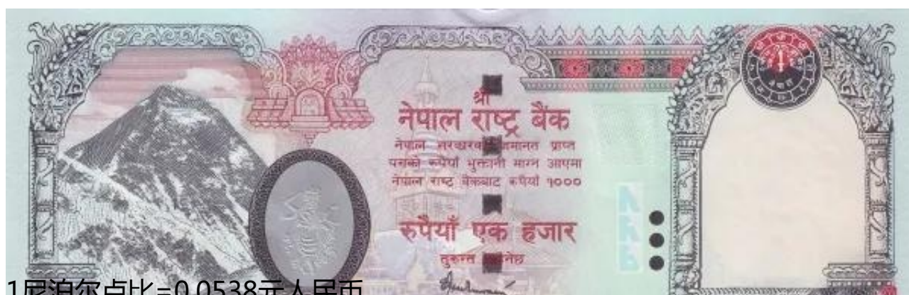
1尼泊尔卢比=0.0538元人民币