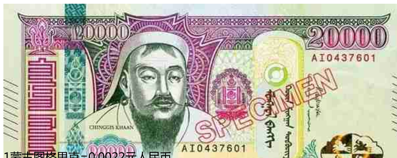
1蒙古图格里克=0.0022元人民币