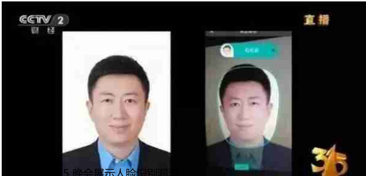
(2017年12月5日晚会展示人脸识别漏洞)

特斯拉的自动驾驶汽车刚出来时，很快就让中国黑客破解了。直到现在也时不时能爆出来破解的消息，也没有多少人觉得特斯拉会因此破产，无人车技术玩不下去。