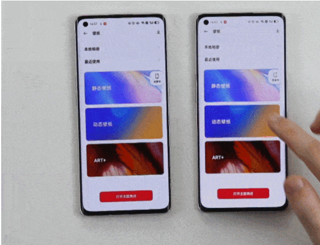
*共享屏幕后的两台手机