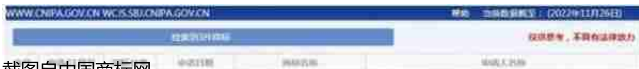
截图自中国商标网。

随着卡塔尔世界杯的开幕，拉伊卜也开始刷屏社媒，和拉伊卜酷似的一名球迷在网络上走红。同时，网友纷纷分享自己DIY的拉伊卜，自己COS的拉伊卜。还有很多网友晒出把自家的猫打扮成拉伊卜的样子，甚至还有网友把拉伊卜做成了饺子。