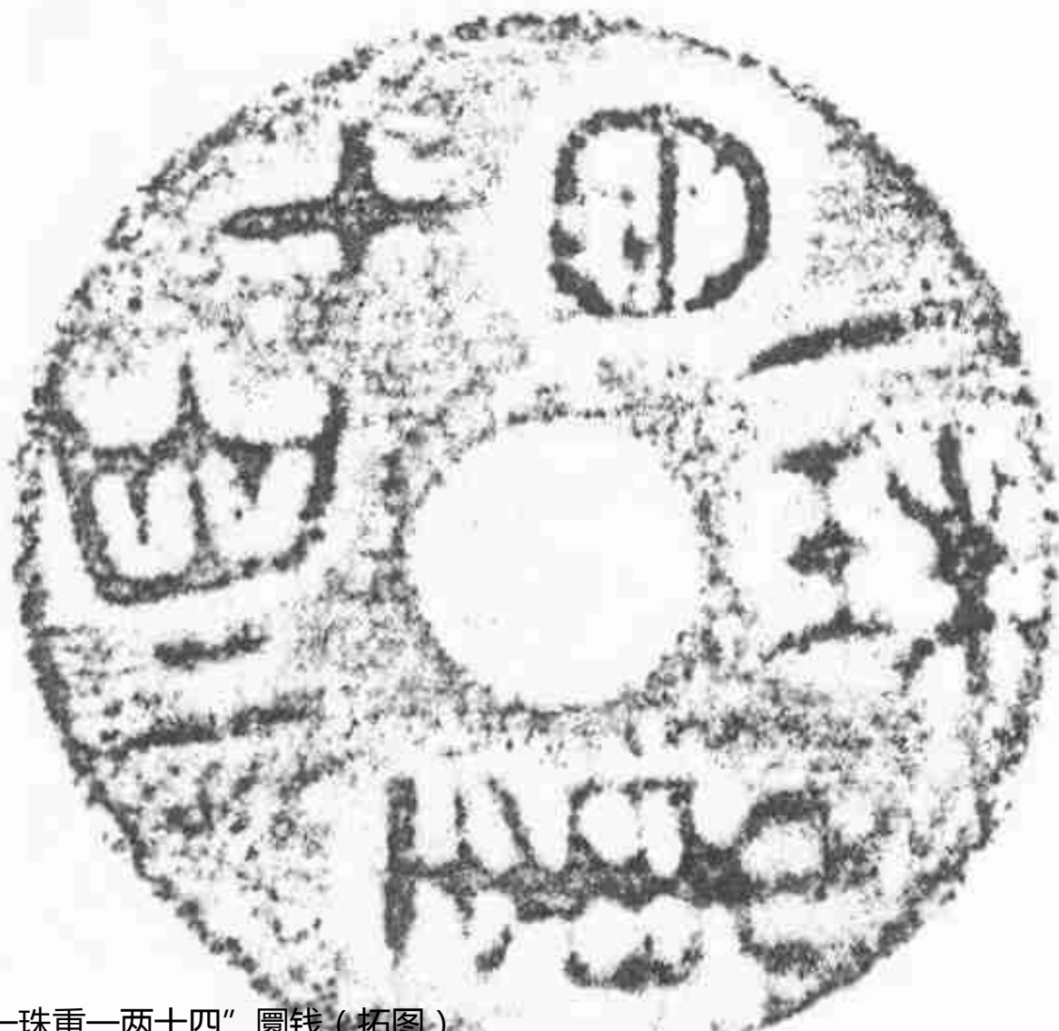
“一珠重一两十四” 圜钱（拓图）

“半圜”是战国时期秦国圆形圆孔圜钱的一种，文字古朴浑厚，有传形，直径27毫米，重12.5克。据说40年代在陕西曾经有出土发现。“半圜”虽然是秦国的钱币，但是，钱文却不纪重量，这又与当时秦国钱币的体制有所不同。可是从型制上来看，应该与“一珠重一两十二”“一珠重一两十四”属于同一时期。单从书法上看