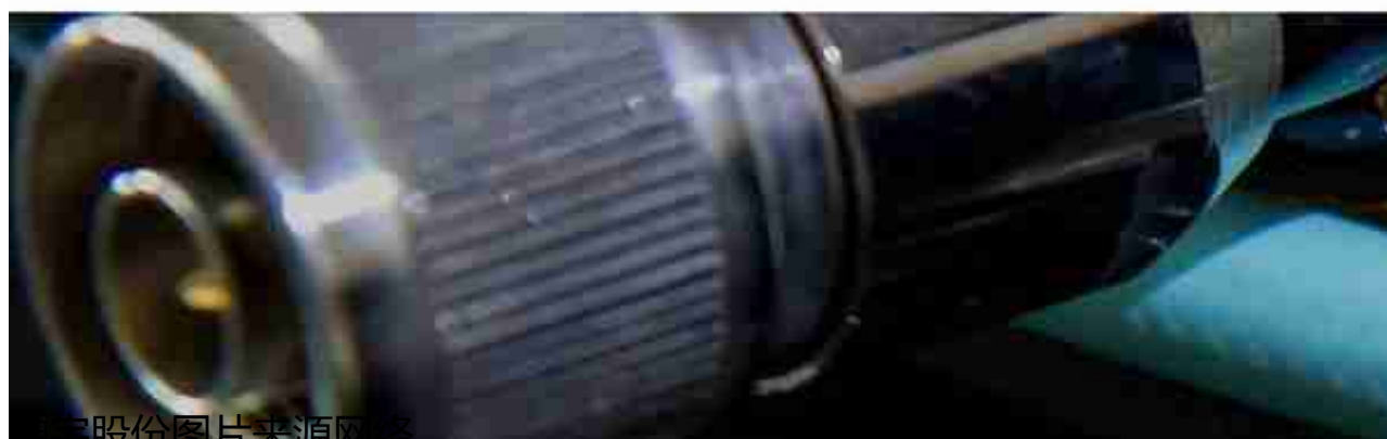
神宇股份

从净利润表看神宇股份2022年6月份净利润3741万元，同比2021年3108万元有所增长。