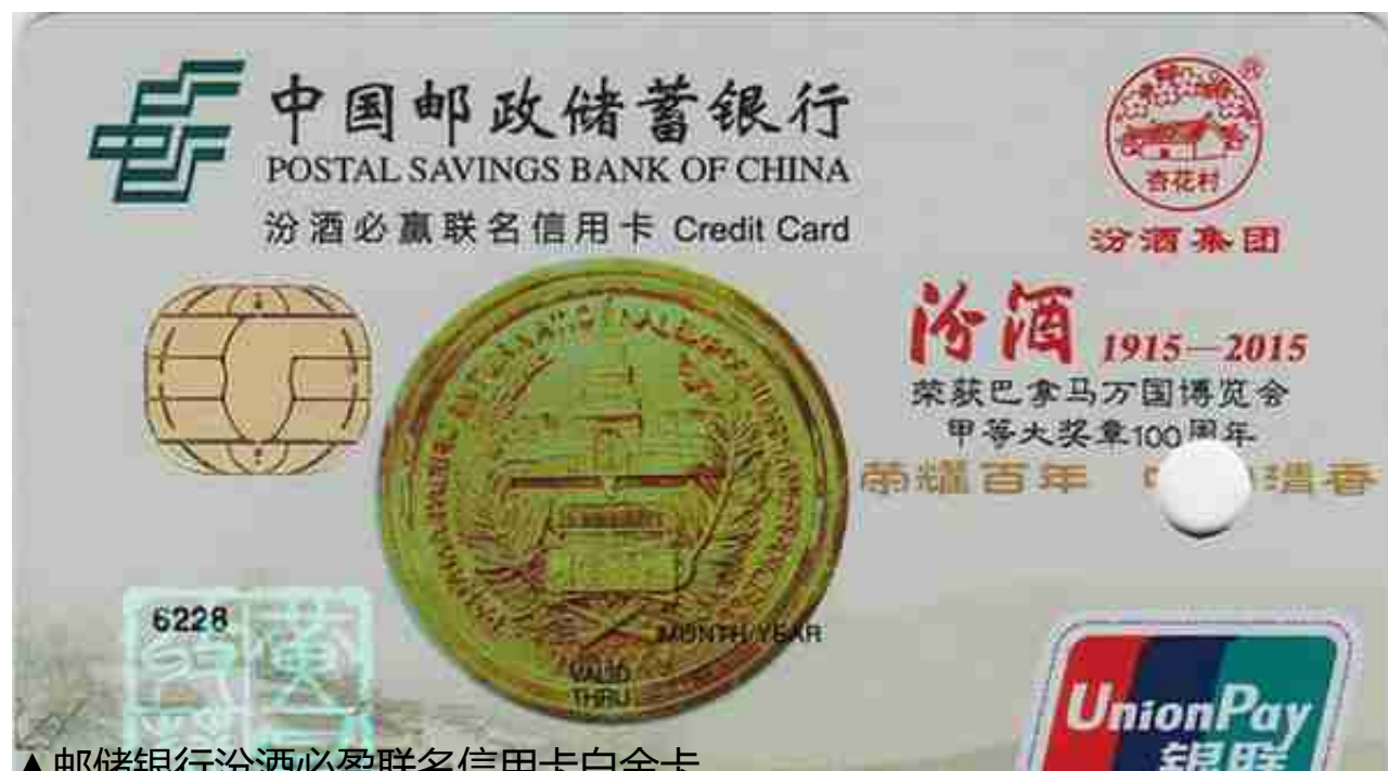
▲ 邮储银行汾酒必盈联名信用卡白金卡