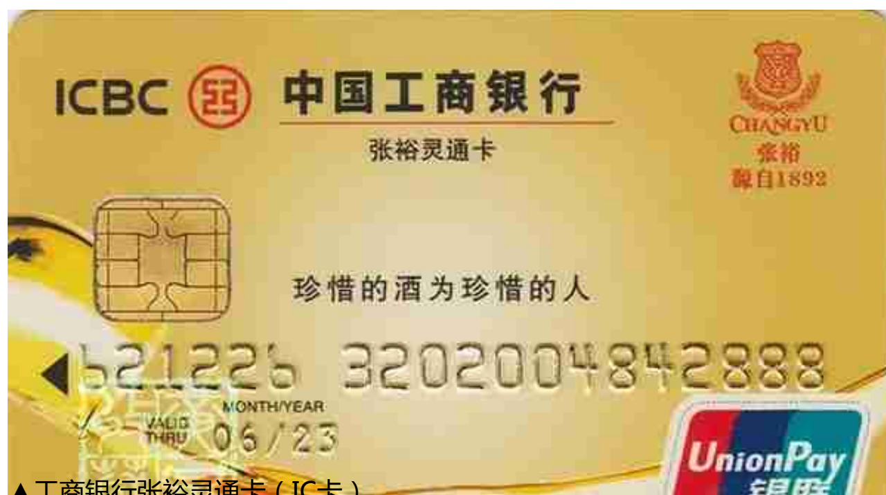
▲工商银行张裕灵通卡（IC卡）

1985年《酿酒》杂志第一期发表了朱梅的《八大名酒产生的前前后后》，这篇文章的作者朱梅是这次评酒会的组织者。他在这篇文章中披露：“我们只在二百多种酒中选出了白酒四个，黄酒一个，白兰地一个，葡萄酒一个，加香葡萄酒一个，一共八个酒。我们评出来的酒的分析资料及对酒提出的意见送交全国专卖会议，这八个酒在全国专卖会议上经过审查一致通过，定为八大名酒。这八个酒是：茅台酒，泸州大曲酒，汾酒，西凤酒，绍兴加饭酒，张裕金奖白兰地、红玫瑰葡萄酒和味美思酒。”