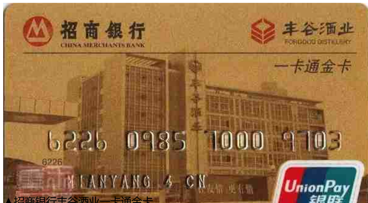
▲招商银行丰谷酒业一卡通金卡

中信实业银行（现中信银行）早期曾经与燕赵都市报、板城烧锅酒联合发行过理财同惠贵宾卡。