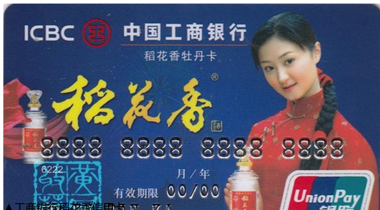
▲工商银行稻花香信用卡