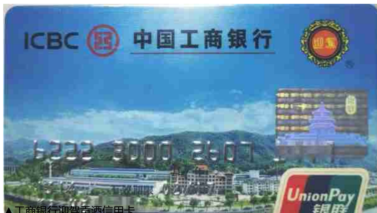
▲工商银行迎驾贡酒信用卡