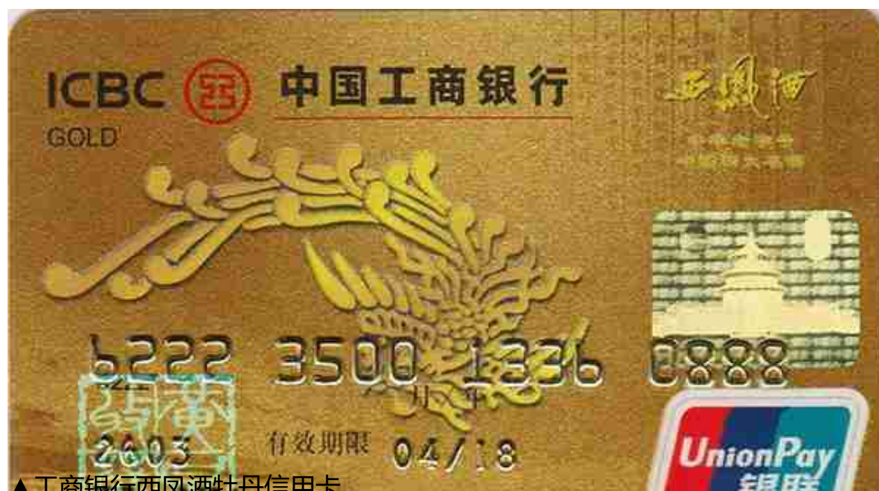
▲工商银行西凤酒牡丹信用卡