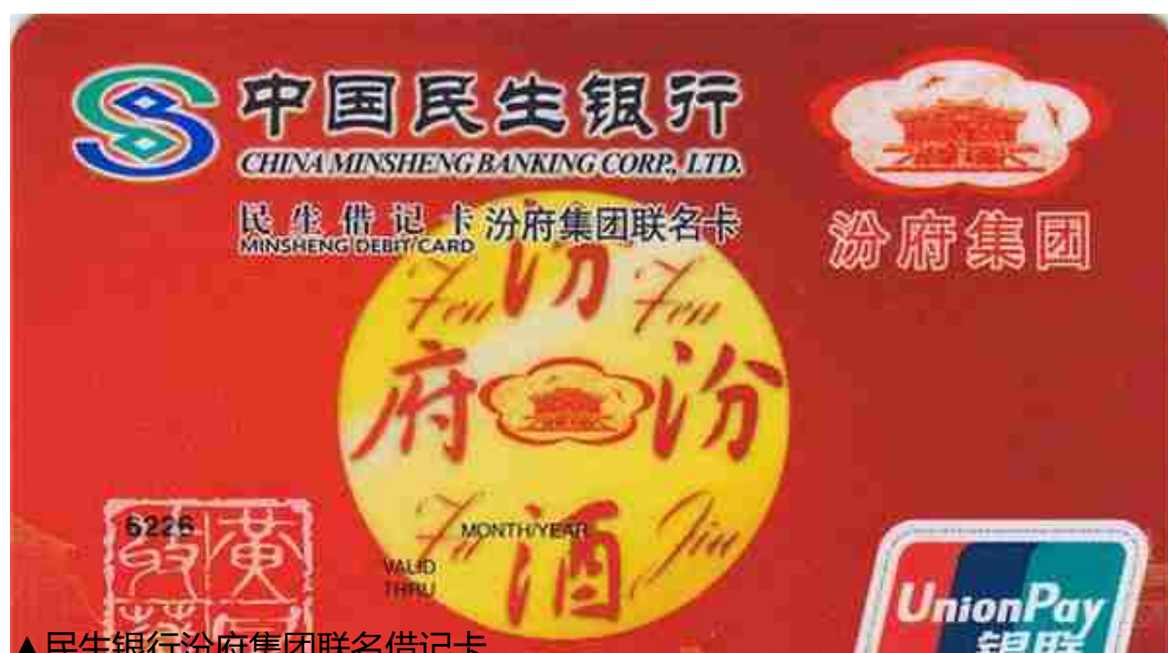
▲ 民生银行汾府集团联名借记卡