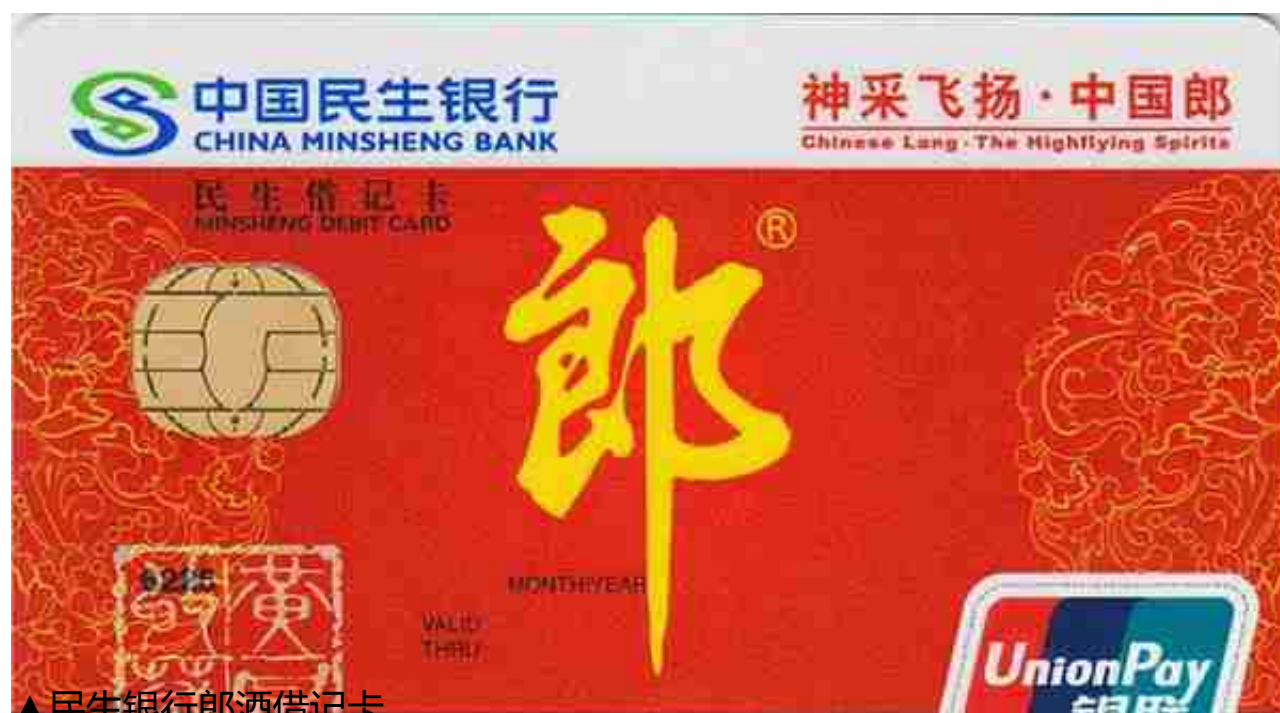
▲民生银行郎酒借记卡

2020年，农业银行安徽省分行携手古井贡酒在安徽亳州市正式发行“古井贡酒无极票号联名信用卡”，首发限量5000张。