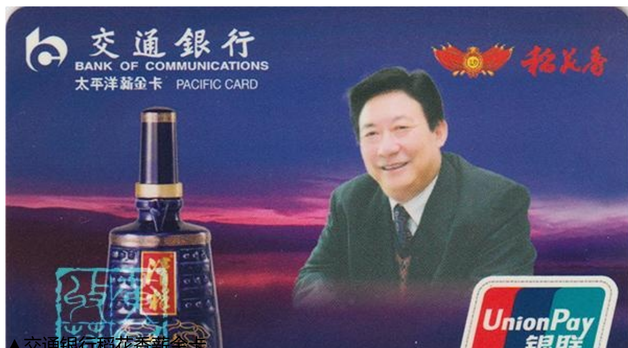
▲交通银行稻花香新金卡