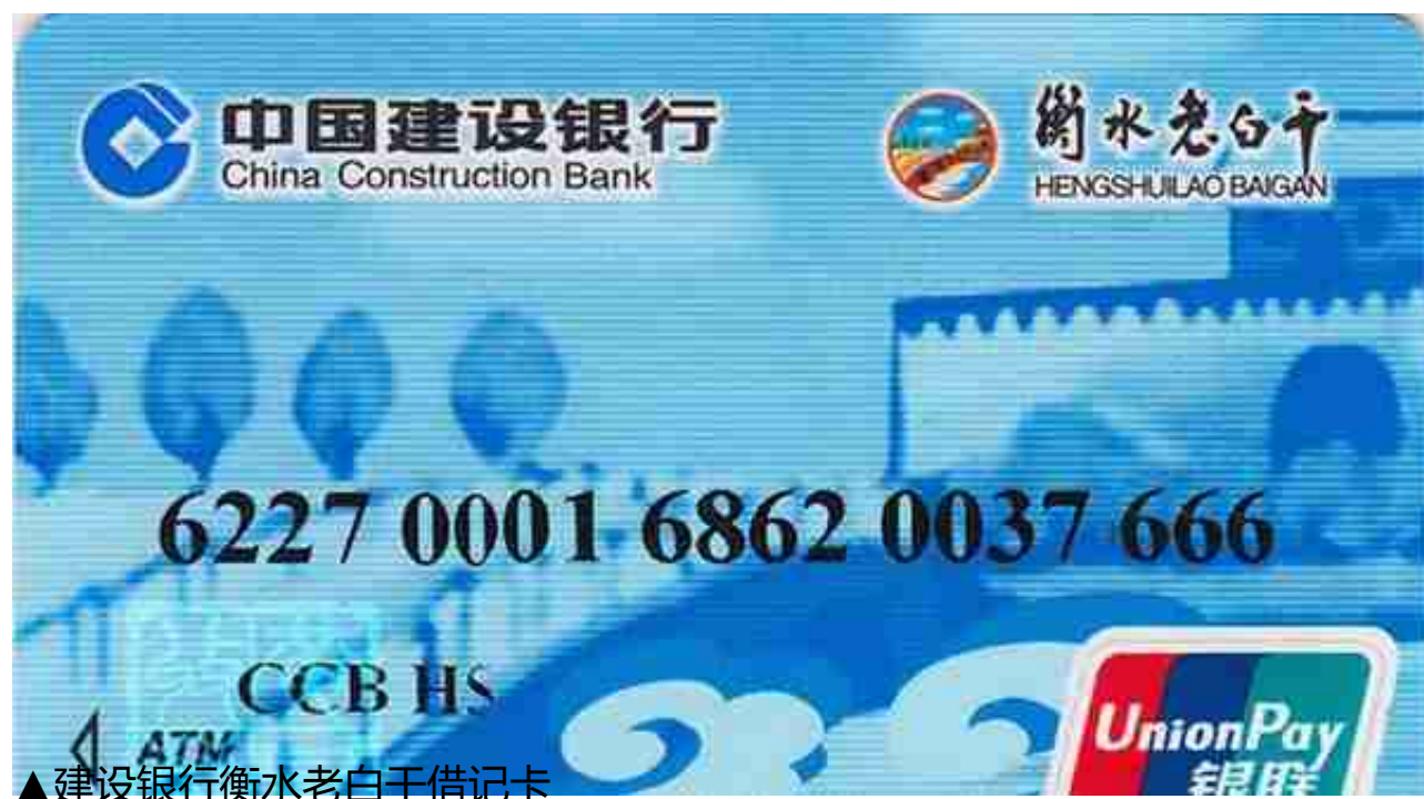
▲建设银行衡水老白干借记卡