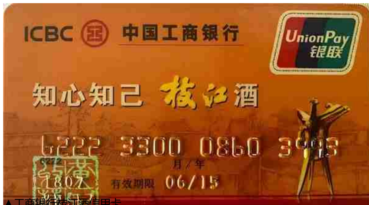
▲工商银行枝江酒信用卡

三花酒得名于清朝，因在摇动酒瓶时，只有桂林三花酒会在酒液面上泛起晶莹如珠的酒花，入坛堆花，入瓶要堆花，入杯也要堆花，故名“三花酒”。