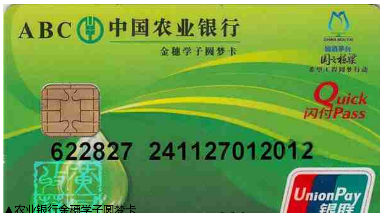
▲农业银行金穗学子圆梦卡

作为“宇宙第一大行”的工商银行，2007年3月与茅台酒股份公司共同推出“牡丹国酒联名卡”。遗憾的是笔者从未见到过该卡“真容”，欢迎广大网友提供。