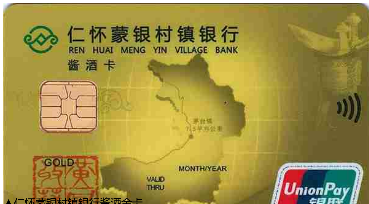
▲仁怀蒙银村镇银行酱酒金卡

仁怀蒙银村镇银行是位于茅台之乡——贵州省遵义市仁怀市的一家村镇银行。作为茅台之乡的当地银行，仁怀蒙银村镇银行发行了“茅台卡”，后改成“酱酒卡”。