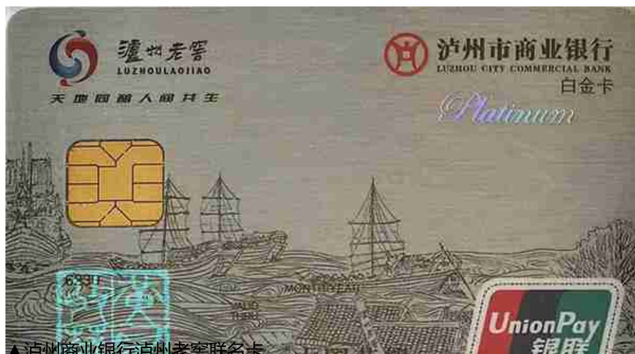
▲泸州商业银行泸州老窖联名卡