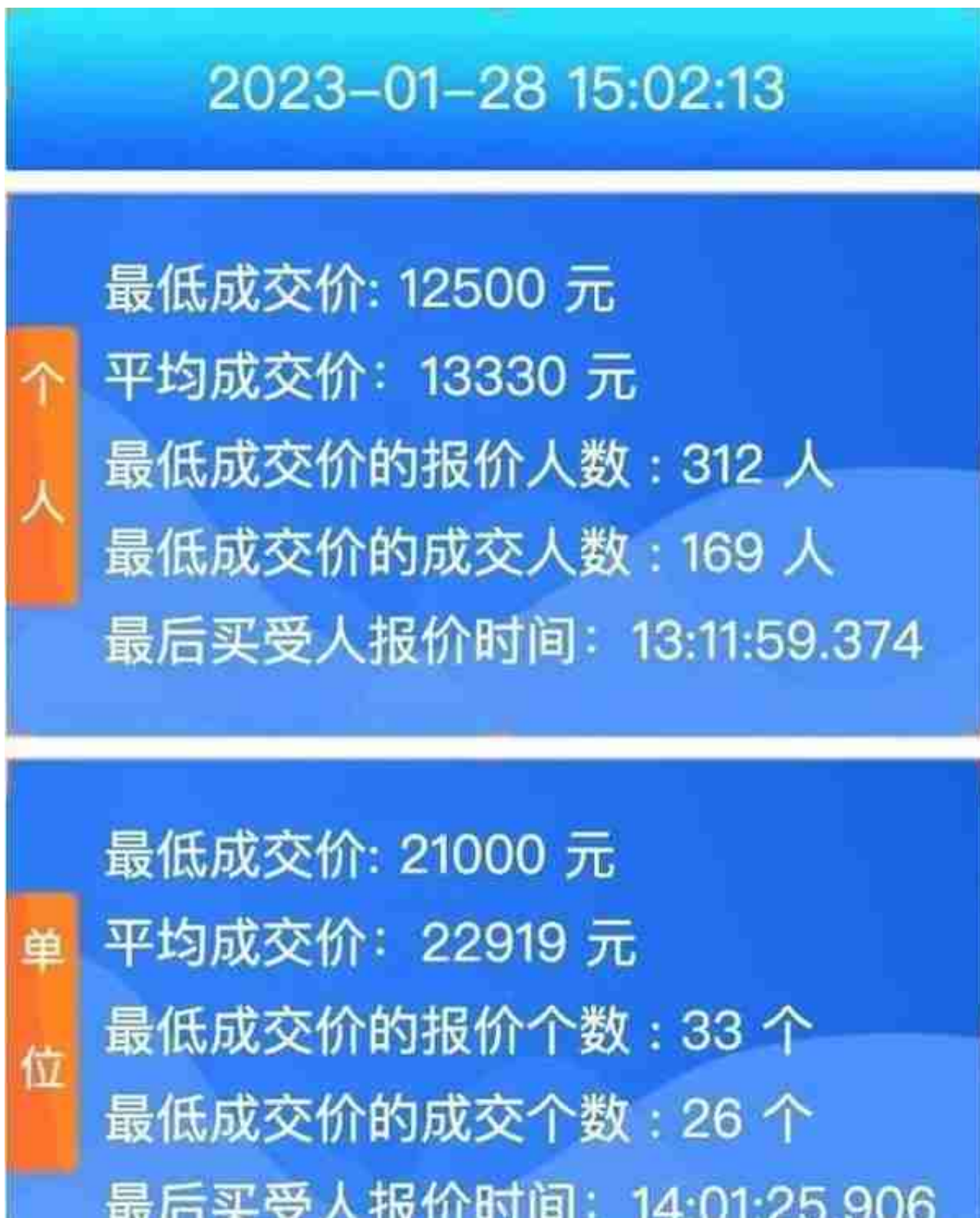
图 | 2023年1月，广州个人车牌成交数据