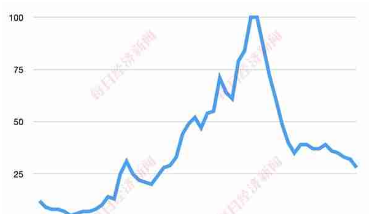
NFT全球热度指数

但进入5月，NFT再度成为热议话题则伴随着“交易量跳水”“智商税破灭”“抛售”等关键词。全球最大的NFT交易平台Opensea数据显示，5月19日全球NFT交易额约3767万美元，较5月1日数据下降约92%。