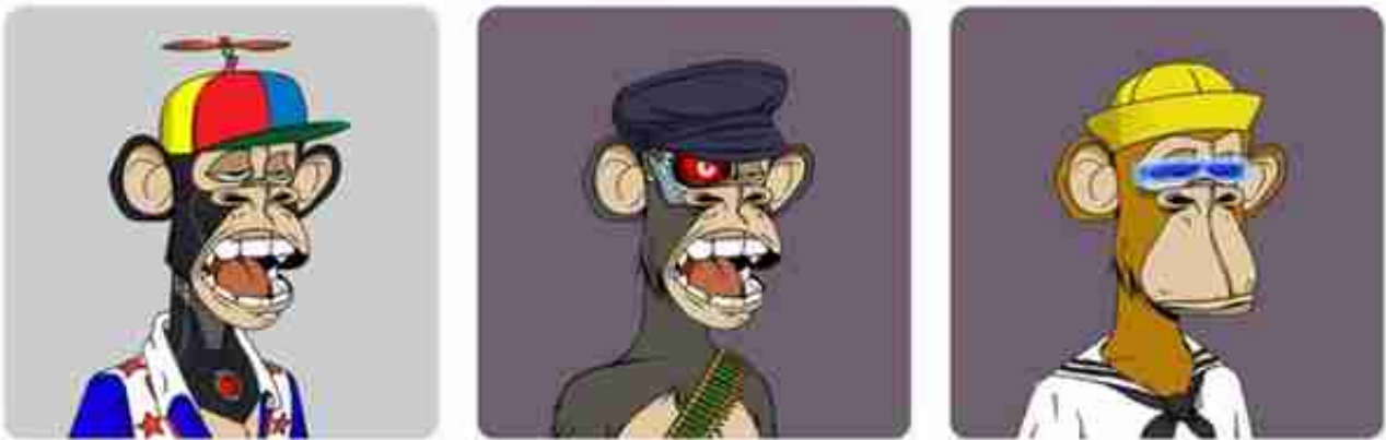
“无聊猿游艇俱乐部”系列NFT近期交易情况。

超2千万美金的像素头像、超9千万美金的艺术作品，NFT的天花板曾在狂热浪潮中不断被抬高。即使在金字塔下端，大众消费级NFT的热度同样不减。例如今年冬奥会期间，单价99美元的冰墩墩NFT在二级市场一度暴涨数百倍。如今，曾经火爆的IP系列NFT价值均出现不同程度的下跌。在危机面前，IP光环也并不护身。