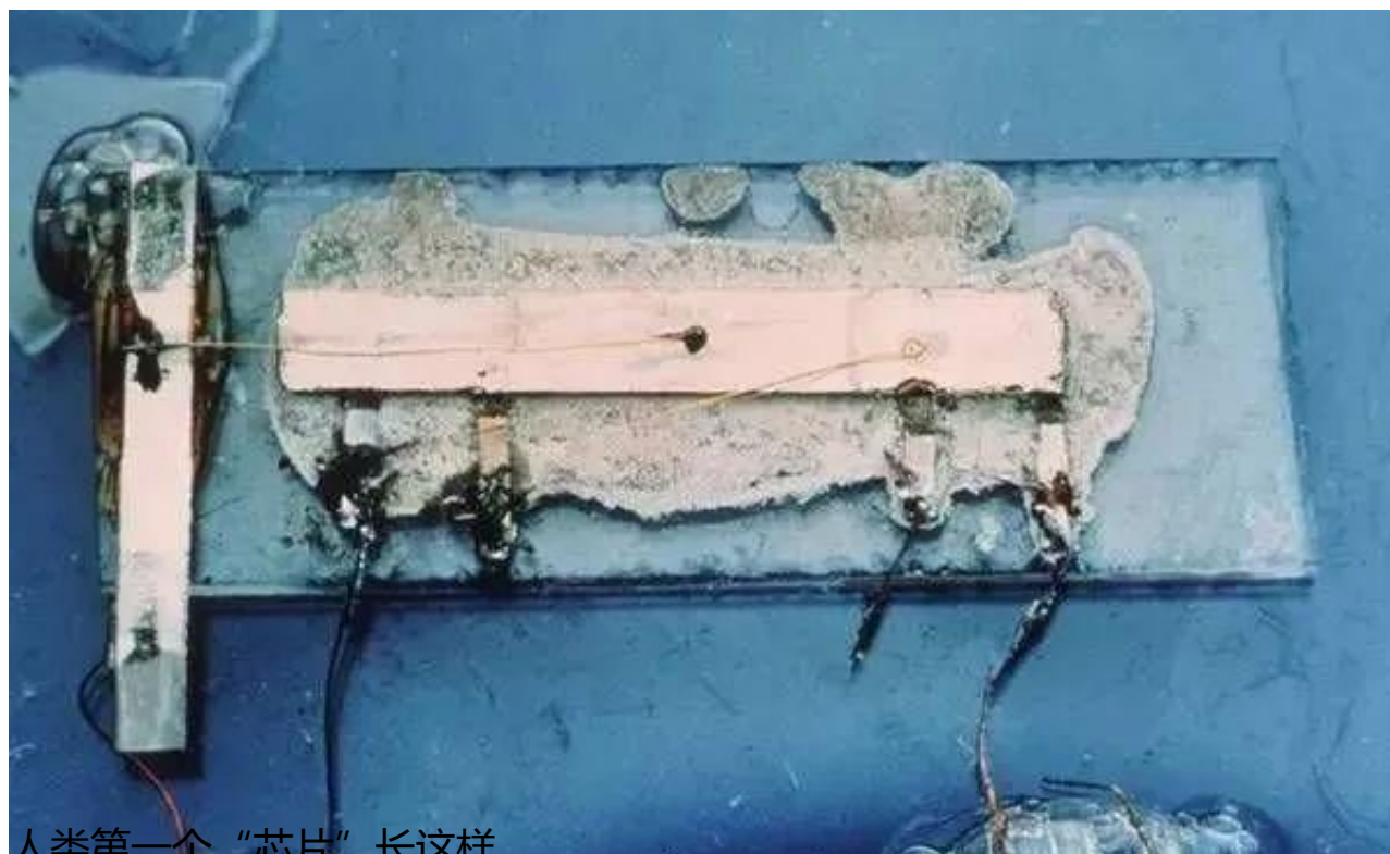
人类第一个“芯片”长这样

电子管的缺点是体积大、功耗大、寿命短；并且，电子管电源利用效率低，用一会就热得烫手。