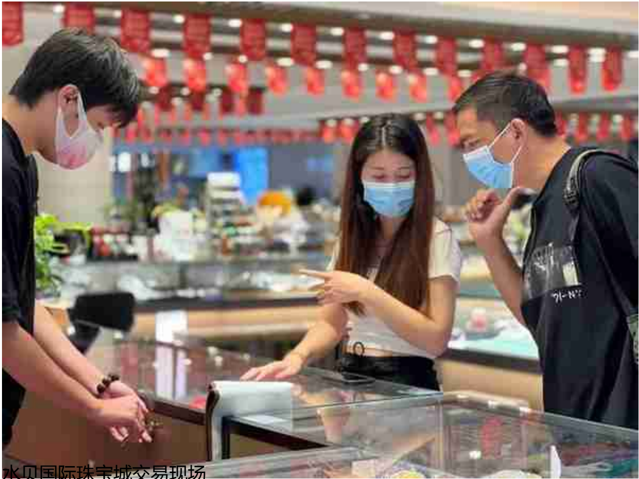
水贝国际珠宝城交易现场

《2022年深圳市罗湖区促进黄金珠宝产业高质量发展行动方案》和《深圳市罗湖区支持黄金珠宝产业高质量发展若干措施》指出：