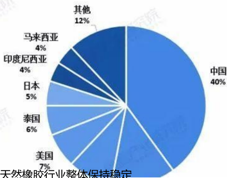
图表2：2019年全球天然橡胶销量区域分布(单位：%)

全球天然橡胶的主要产区在东南亚，根据IRSG数据显示：泰国占全世界比重的37.00%，印度尼西亚占全球比重为23%，越南为9%。三个国家合计约为70%。