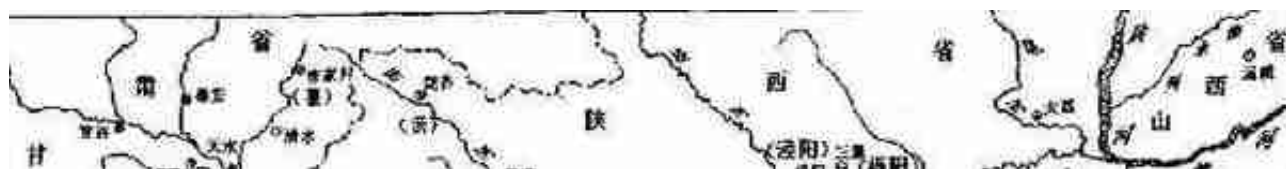
图1-1 秦九都八迁路线示意图