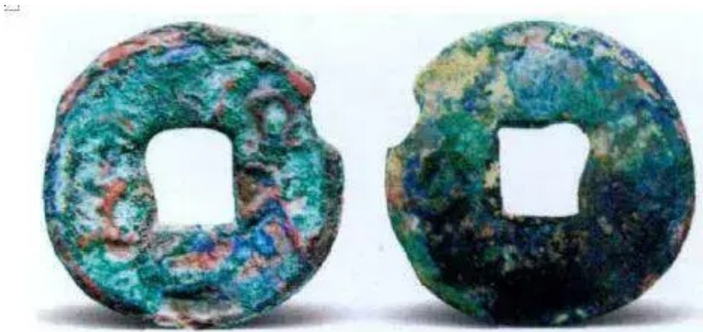
图 1-7 “襄阴二”钱（正、背） 直径：28.5 毫米